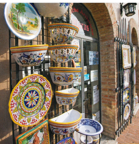
A fronte, la fontana di Piazza dei Consoli e una colorata decorazione in maiolica nel centro storico di Deruta. Sopra, la rivendita di ceramiche artistiche della ditta Maras. In basso, il campanile del complesso conventuale di San Francesco e l'interno della fornace San Lorenzo.

Vale la pena di iniziare la visita alla cittadina proprio dalle sale del Museo Regionale della Ceramica, che raccoglie più di seimila opere moderne e antiche tra vasi, piatti e arredi e risale all'epoca d'oro rinascimentale della